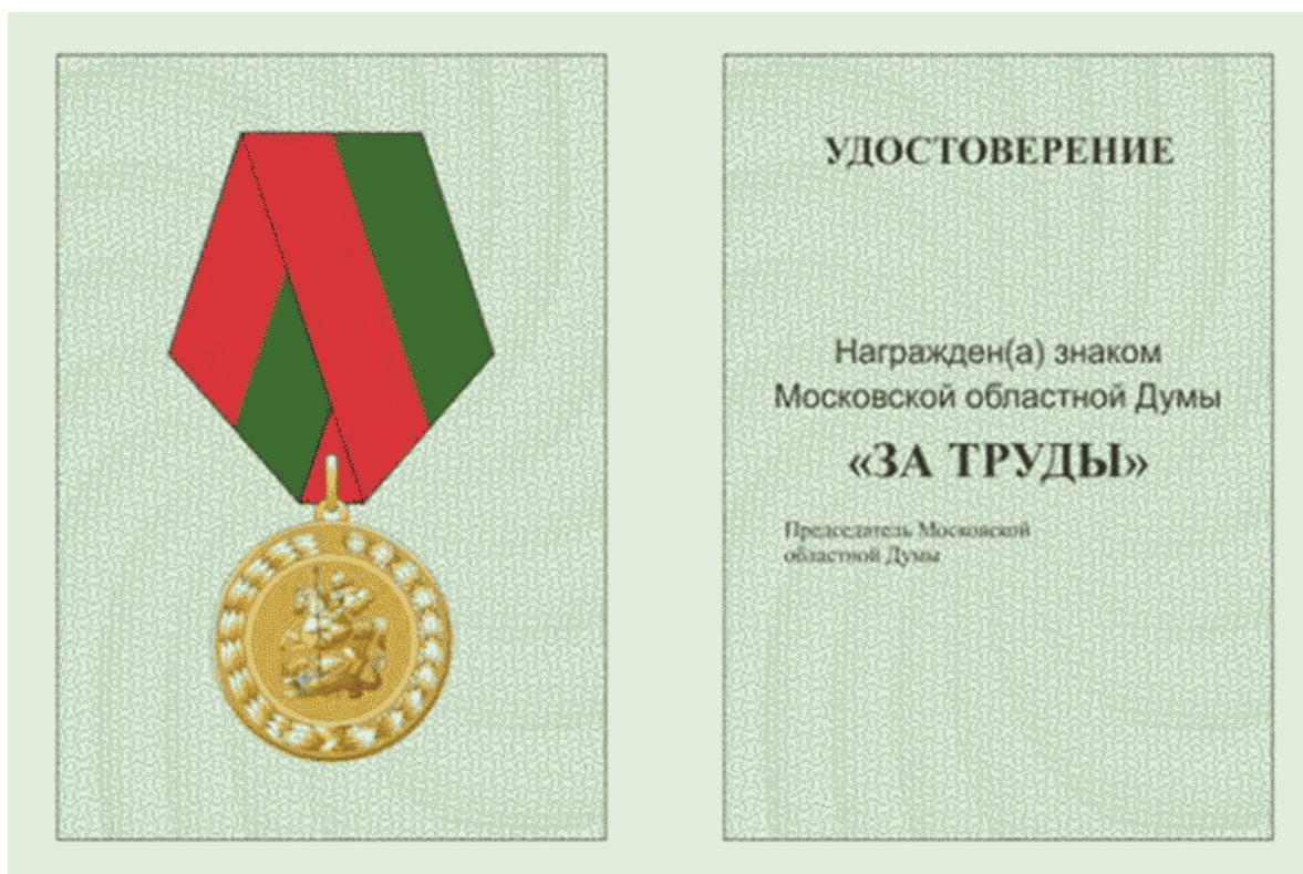
Описание удостоверения к знаку Московской областной Думы "За труды"