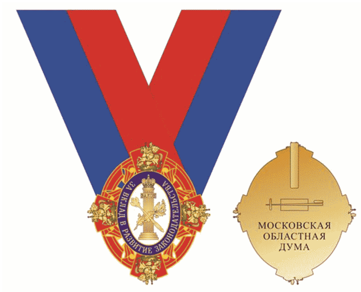
Многоцветный рисунок миниатюрной копии знака Московской областной Думы "За вклад в развитие законодательства" I степени