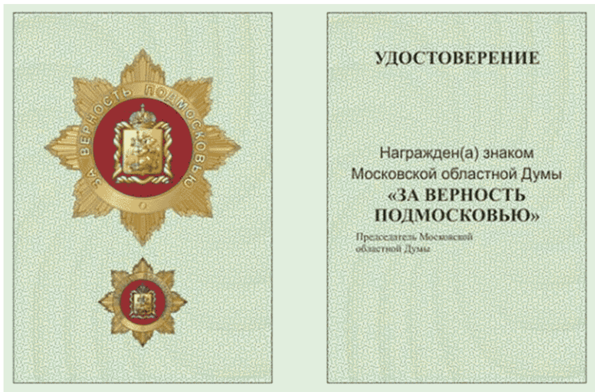
Описание удостоверения к знаку Московской областной Думы "За верность Подмоскoвьeю"