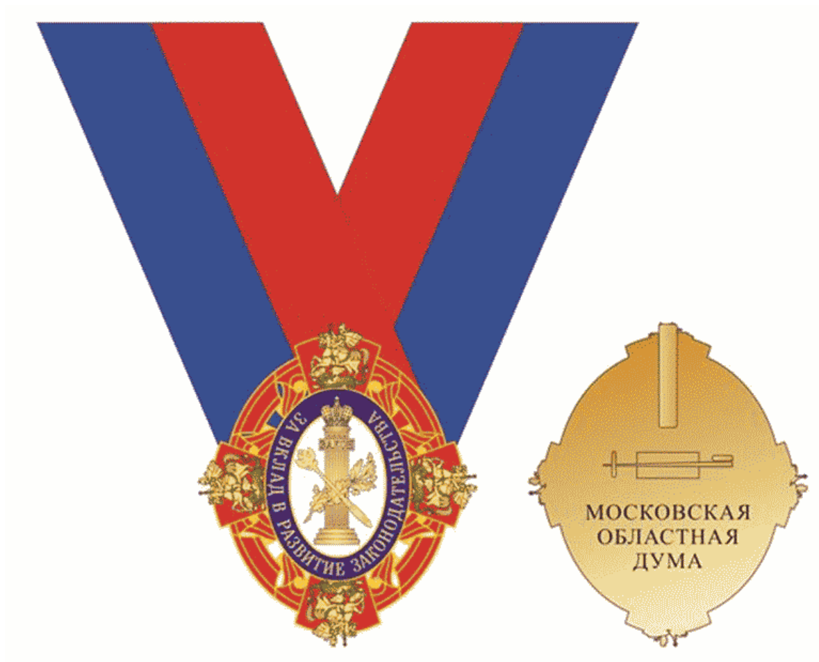
Многоцветный рисунок миниатюрной копии знака Московской областной Думы "За вклад в развитие законодательства" I степени